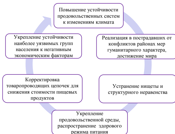
Рисунок 1. Укрупненные направления совершенствования продовольственных систем на глобальном уровне