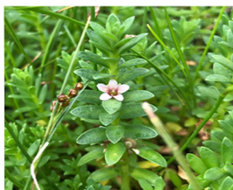
Glaux maritima L.

Исследование выполнено за счет гранта Российского научного фонда, № 21-74-00035, https://rscf.ru/project/21-74-00035