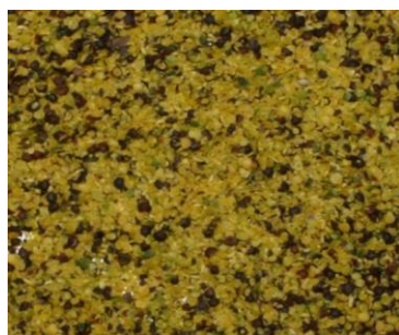
Рис. 3. Фракция ядра семян рапса после обработки в пневмосепараторе, содержание ядра 92 %, оболочки 5 %

Проведенные исследования жирнокислотного состава масел из целых семян рапса и очищенных от оболочек ядер показали, что качественный состав жирных кислот в маслах одинаков, однако количественный состав несколько отличается. В масле, полученном из очищенных ядер, почти на 25 % снижалась доля эруковой кислоты и увеличивалась на 5 % доля незаменимой (эссенциальной) \alpha -линоленовой ЖК семейства \omega -3, что повышает пищевую ценность и уровень безопасности масла. Было отмечено, что масло из очищенных масличных ядер имеет меньшие значения цветного, кислотного и перекисного чисел, что также свидетельствует о повышении его качества [4].