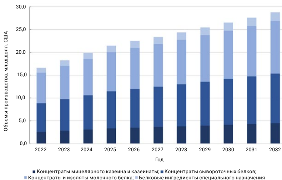
Рисунок 1. Динамика мирового рынка белковых ингредиентов на основе молочного сырья 3

молочного сырья не только увеличивать объемы производства, но и разрабатывать новые виды сухих белковых ингредиентов, способствующих расширению областей их применения 2 [1]. К числу таких ингредиентов (см. табл.) относятся концентраты и изоляты сывороточных белков (КСБ / ИСБ),