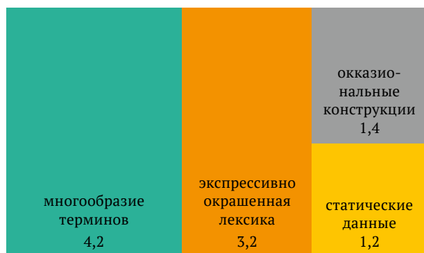
Рис. 1. Соотношение вербальных знаков различных подсистем в медиаматериалах о диджитализации общества, % Fig. 1. Correlation of verbal signs of different subsystems in media materials about social digitalization, %

познакомились (или не познакомились) с компьютерами и о том, как оцифровка государства и услуг изменила их жизнь, и т.п. (Lifo, 24.03.2022);