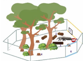
1 - вход во внутренний вольер; 2, 3, 4 - пути; 5 - купально-питательная зона; 6 - экспозиционная точка

Введение: Гигантский муравьяда впервые в России был завезен в Калининградский зоопарк в 2017 году в рамках программы по сохранению и размножению этого вида. У самца гигантского муравьяда в Калининградском зоопарке было отмечено стереотипное поведение, но исследовательские стереотипы у данной особи не проводились.